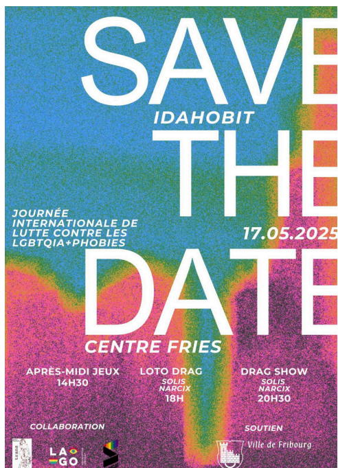
L'affiche de l'événement

La Queer Studies Week de 2024 n'a pas connu de nouvelle édition en 2025. Aussi, pour marquer le 17 mai, soit la journée mondiale de lutte contre les queerphobies, nous avons contacté les associations Sarigai et Lago pour organiser ensemble un événement à cette occasion.